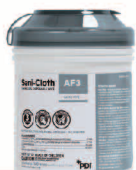
无醇型 物表消毒湿巾