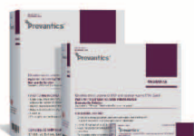
洗必泰 皮肤消毒系列