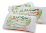
术前洗必泰 沐浴海绵